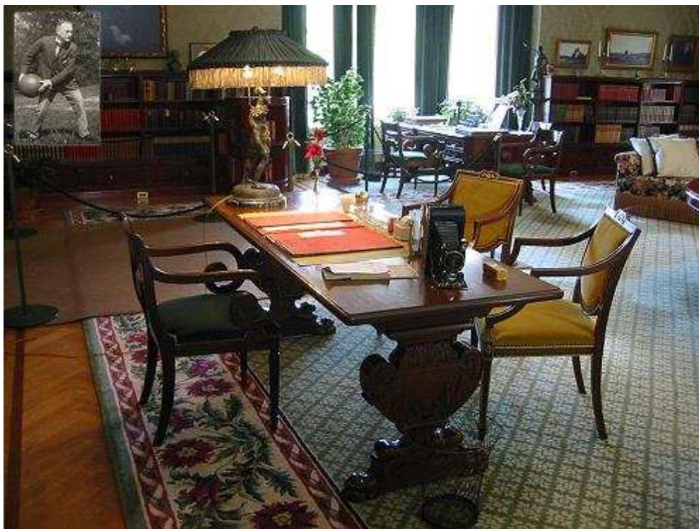
Mittwoch, 11.10.2006 Tagesausflug zum Letchworth State Park